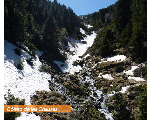
Còrrec de les Collisses

5. Du Ras dels Cortalets, empruntez l'itinéraire balisé en rouge et blanc qui correspond au GR®10, GR®36 et GR®T83 pour rejoindre le refuge d'où vous pouvez atteindre le sommet du Canigó. Comptez environ entre 1 h 30 et 2 h de marche.